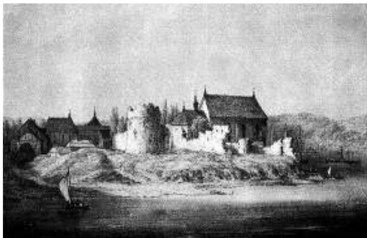
Kauno senamiestis ir pilis XIX amžiuje. Napoleonas Orda, 1875 m.

1391 m. pasibaigus vidiniams vaidams, Vytautas galutinai įsitvirtino Kaune, Rittersverderio pilies rezidencijoje. Įsiveržus kryžiuočiams pilis ne kartą buvo sugriauta ir vėl atstatoma (jos pamatų liekanos buvo aptiktos dabartinės Kunigų seminarijos teritorijoje).