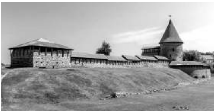
Rekonstruota Kauno pilis šiandien

apsistodavo aukšto rango asmenys. XVI a. pilis buvo rekonstruota, pastatyta bastėja (šiuo metu jos bokšte – Kauno regiono Informacinis centras).