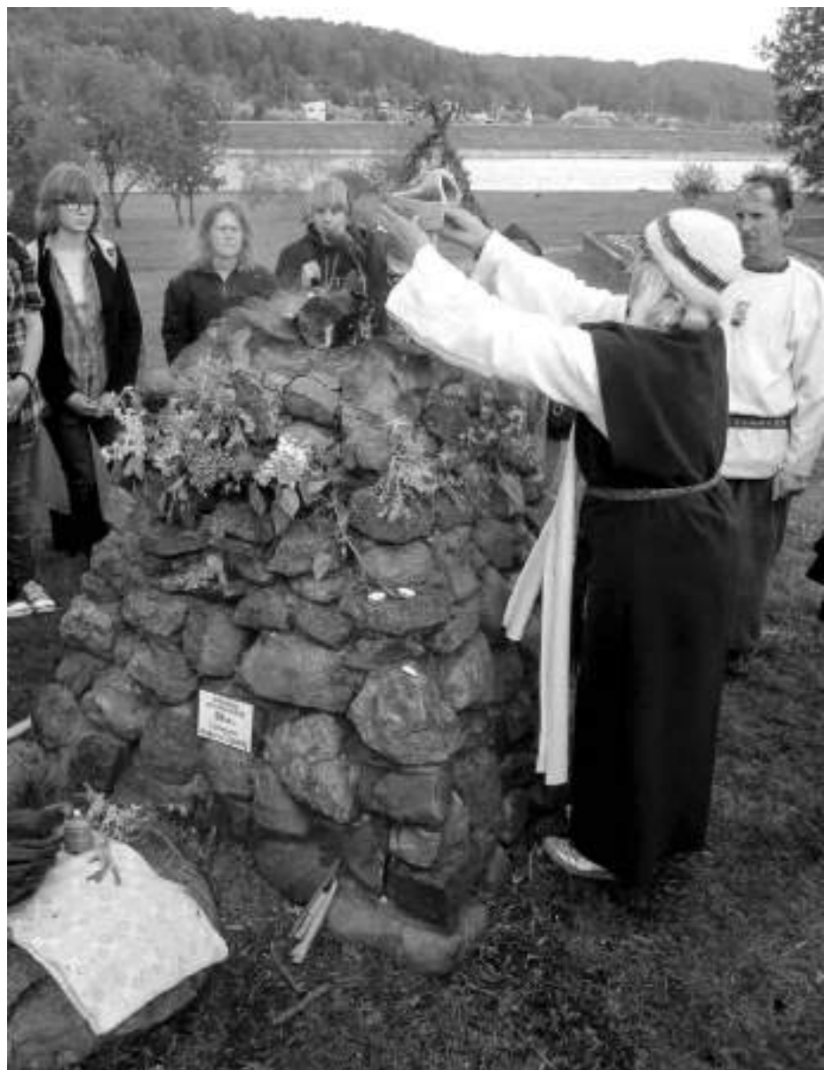
Mildos šventė Kaune.