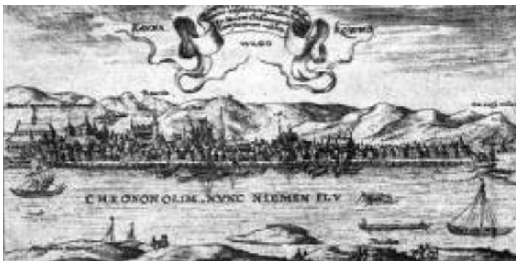
Kauno panorama. T. Makovskis, 1600 m.

Kryžiuočių antpuoliai tęsėsi. 1383 m. jie iškasė kanalą nuo Neries iki Nemuno ir susidariusioje saloje pastatė naują tvirtovę – Rittersverderį ( Ritterswerder ), tačiau lietuviai